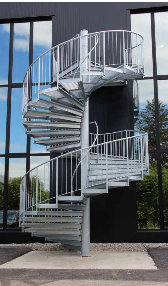
Zwei Gitterrost-Spindeltreppen gewähren den Fluchtweg am Firmengebäude.